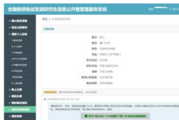
已推免至厦门大学攻读硕士研究生