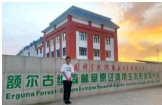
赴中科院额尔古纳草原过渡研究站实习

勇于追梦、敢于创新正是青春本色。三年来她参与国家级大创项目、发表核心论文、投身专业竞赛，组建“校园植物鉴别团队”开启了为期两年的校园植物调研之旅，3 万余张照片见证了我与团队的奋斗故事。为了熟悉植物的分布，她牺牲周末时间深入校园角落采集标本；为了准确鉴别物种，她泡在图书馆学习分类知识；最终形成了师大第一本《校园草木图志》，记录 64 种木本植物和 8 种最具代表性的草本植物，涵盖“裸子植物”、“被子植物”以及“草本植物”，全书对每一种植物提供了中文俗名和拉丁学名，并对植物的校园内地域分布、形态特征、生活习性、主要价值进行了介绍。同时，每一种植物都配