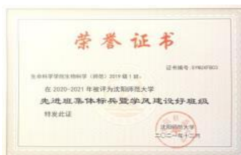
带领班级获“先进团支部”“先进班集体标兵”称号