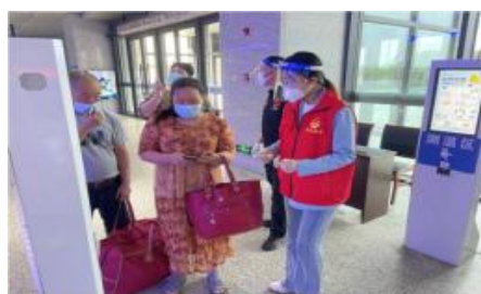
参与家乡创城之火车站引导志愿活动

虽然日常学习与工作填满了她的的作息时间表，但是她始终不忘参加社会公益活动。志愿服务仿佛是她生活不可或缺的一部分，同学们经常能看到她洋溢青春气息的身影。她作为校园疫苗接种志愿者登记信息，耐心告诫接种后的注意事项；作为提前返校志愿者，帮助同学清扫寝室搬运行李；作为社区防疫志愿者，督导业主佩戴口罩。