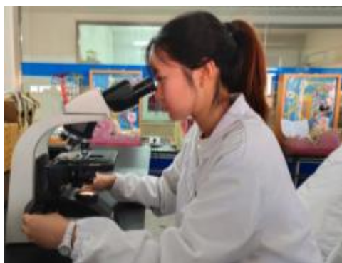
认真完成课堂实验

程再艰辛，她坚信只要持之以恒，终会柳暗花明。最终 33 门课程有 29 门达到满绩，平均学分绩点由大一的 3.20 上升到现在的 3.96，四项测评均位列专业第一。暑假期间广泛参与高校夏令营，最终推免至厦门大学世界一流建设学科生物学专业攻读硕士研究生，继续在更高的领域潜心探索，为科技强国贡献力量。此外，暑假期间她申请到了前往中国科学院额尔古纳研究站实习的机会，研究环境压力下草原蜘蛛多样性的响应机制，采集昆虫标本 2 万余头。