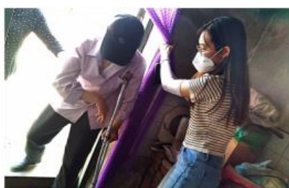
志愿帮助社区残疾老人